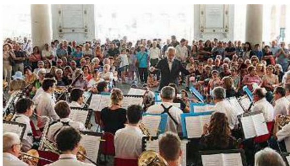
Classica e non solo. Note di tutti i tipi oggi in città

Dalle 10 alle 24 su sessanta palchi si alterneranno tra diversi generi migliaia di musicisti A PAGINA 10-11