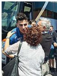
Incoraggiamenti Tifosi al S. Filippo