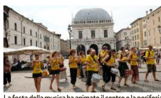
La festa della musica ha animato il centro e la periferia

Brescia capitale della musica con una festa che ha fatto ballare periferie e centro. Una giornata che ha regalato un numero imprecisato di ore dedicate alla musica, in ogni sua possibile forma e genere. Cifre alla mano sono stati animati una novantina di palchi sparsi per vie e quartieri, oltre 3500 musicisti impegnati, l'80% dilettanti. La musica ci ha messo la magia. MANESSI PAG 14-15