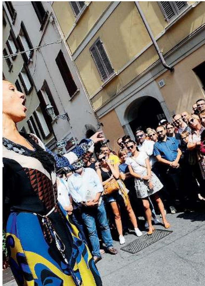
In ogni strada. Sabato la musica prenderà possesso della città

che ha reso vincente la nostra Festa della Musica e dobbiamo proseguire in questa direzione». Restano dunque i capisaldi di un evento che non ha bisogno di troppe spiegazioni: le quattro passate edizioni sono la più evidente testimonianza di un'intuizione felice - quella di Jean Luc -, colta dalle istituzioni e fatta propria dalla collettività: mondo della musica e del volontariato in primis. In cinque anni la Festa - perché soprattutto di una festa si tratta - ha coinvolto più di 15mila musicisti, con 3.770 performance di ogni genere in cento luoghi di-