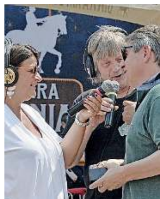
All'opera. Maddalena col sindaco

Come di consueto Radio Bresciasette seguirà in prima linea anche questa edizione della Festa della Musica e sarà «on air» per dodici lunghissime ore fra ospitate, esibizioni, interviste e chiacchierate con i rappresentanti delle istituzioni e con gli artisti, che sempre volentieri si presentano all'appuntamento con i microfoni della nostra radio.